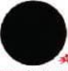
EP876* Magnesium Նիլոնադեղին