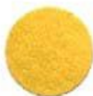
40/1123 Sparkling Gold Մրդեղամուգն