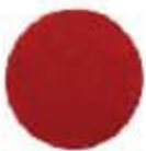
1108 Yamaha Red Նիհոնական