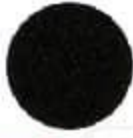
Y124* Star Silver Եվրոպեական