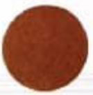
W41** New Bronze Նիլոն