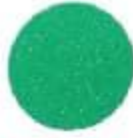
1380 Light Jade Եվրոպեական