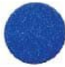
80/1147 Ocean Blue Եվրոպեական