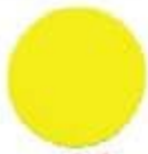
56** Fluorescent Yellow Եվրոպեական