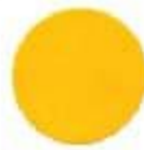
55** Fluorescent Orange Նիլոնադեղին