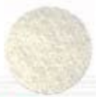
W39** Metallic Silver Եվրոպեական