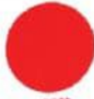
57** Fluorescent Red Եվրոպեական