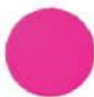
53** Fluorescent Pink Մրդեղամուգն