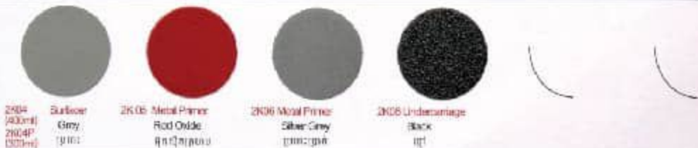
2K04 Surface Grey စိမ်း