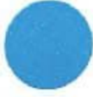
2511 Blue Legend Եվրոպեական