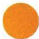
1102 Honda Yellow Եվրոպեական