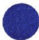
65/1143 Violet Blue Կապույտադեղին