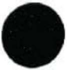
1144 Super Green Եվրոպեական