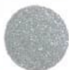
39/1701 Sparkling Silver Մրդեղամուգն