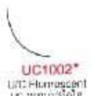
UC1002* UVC Hummagent Լուսնամուգն