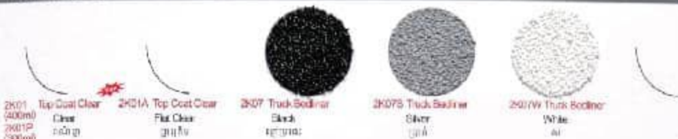
2K01 Top Coat Clear Clear အရောင် မရှိ