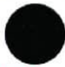
81/1139 Metallic Black Լուսնամուգն