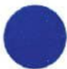
1103 CTM Honda blue Եվրոպեական CTM