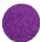
64/1142 Super Violet Նրբադեղին