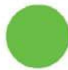
54** Fluorescent Green Եվրոպեական