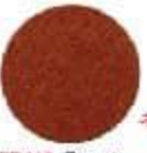
EP41* Bronze Նիլոն