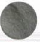
C018** Decorative Chrome Եվրոպեական